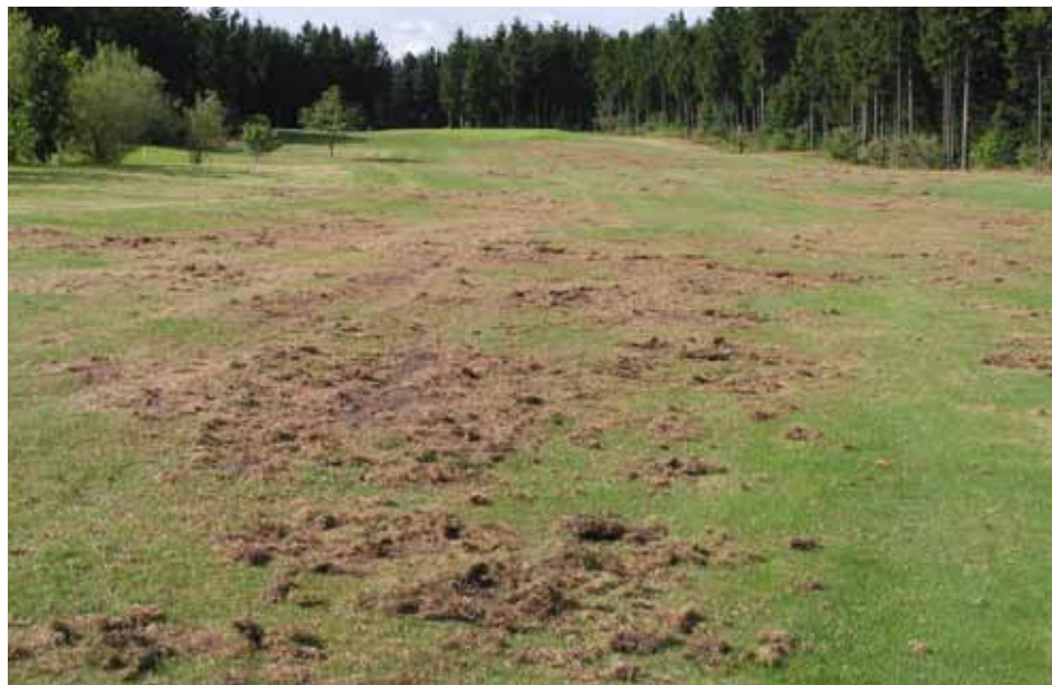
Angreb af gåsebiller (og fugle) på fairway på Give golfbane

Trädgårdsborre Hageoldenborre Tarhaturilas Garðadjásn June Beetle