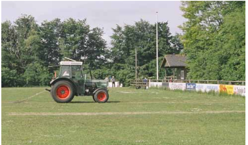
Forsøg på Ørnhøj stadion, Jylland.

Gåsebiller er typiske steppe dyr, der trives på tørre, sandede jorder. Så godt drænedede golfbaner og idrætsanlæg med grusunderlag giver ideelle betingelser for larverne.