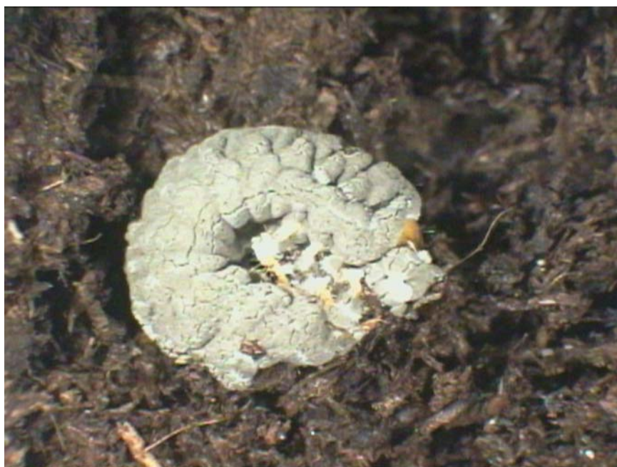
Figur 4. Død gåsebillelarve inficeret med M. anisopliae KVL 99-114.