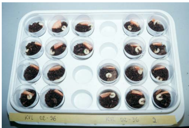
Figur 1. Bioassay opstilling med gåsebillelarver (uden låg).

i op til 6 uger. Hvert assay bestod af 3 gentagelser med 10 larver. Larverne blev fodret efter behov med gulerodstykker.