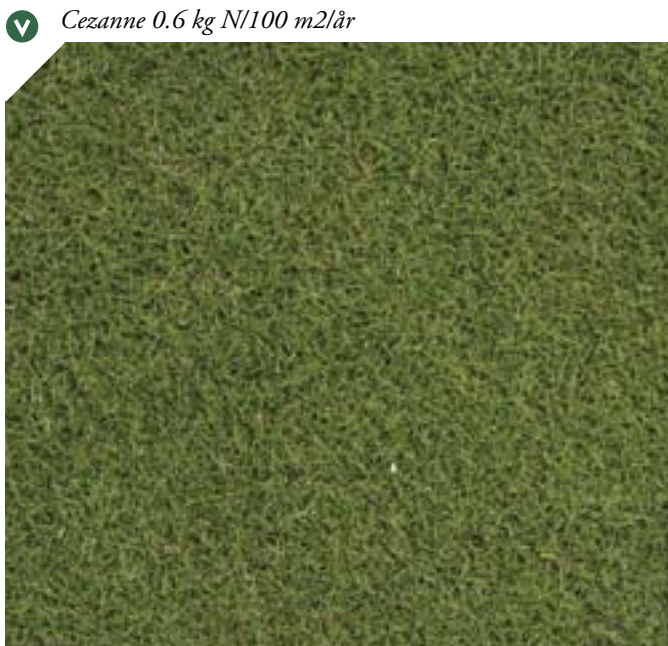
▼ Cezanne 0.6 kg N/100 m2/år