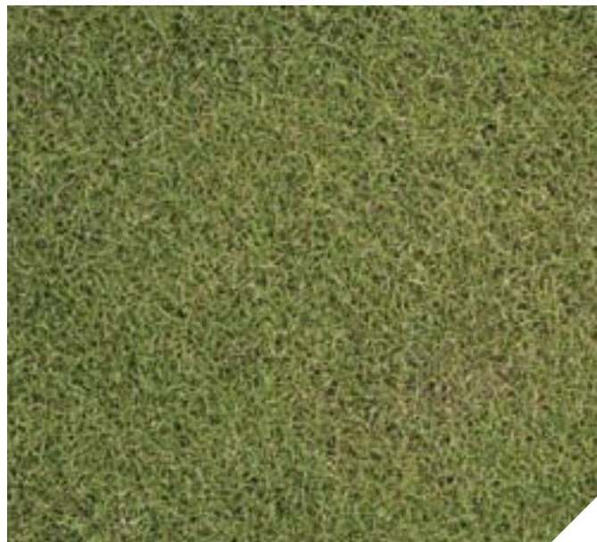
▲ Leonora 2.0 kg N/100 m2/år