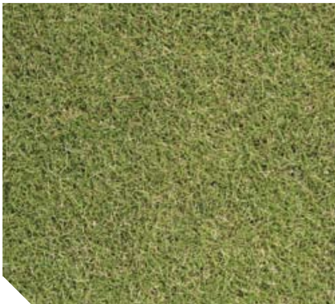
▲ Leonora 0.6 kg N/100m2/år