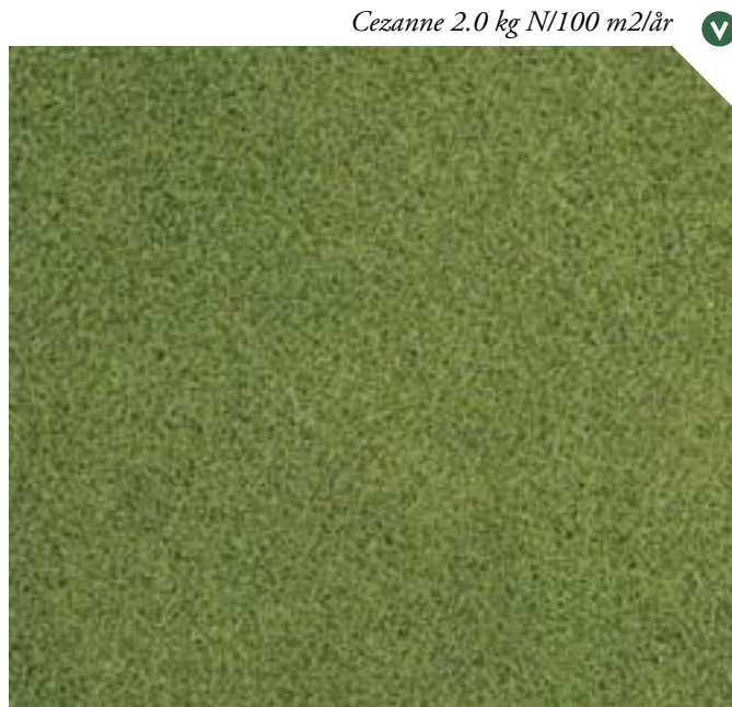
▼ Cezanne 2.0 kg N/100 m2/år